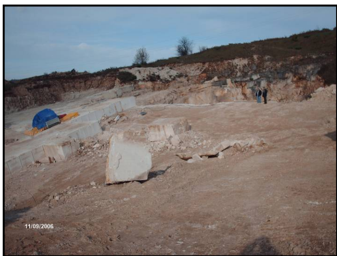
Slika 2. Kamenolom Bihacita na lokalitetu "Maskara"

Ležište je istraživano u više navrata, a najviše podataka je dobijeno izradom OGK - list Bihać. U cilju određivanja količina, kvaliteta, te mogućnosti primjene ukrasnog kamena realiziran je projekat geološko - istražnih radova. Projektovani radovi su izvedeni kao: geodetski, geološki, rudarski i laboratorijski radovi.