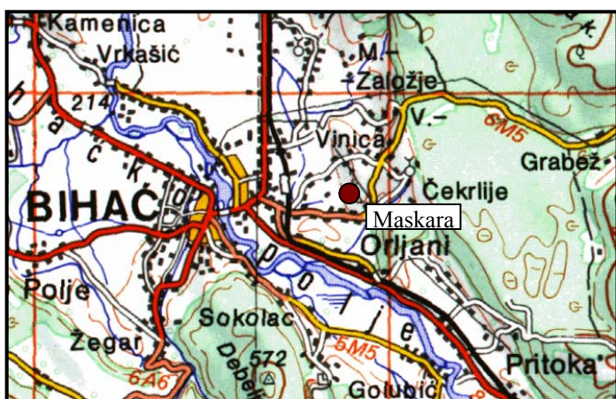
Slika 1. Pozicija ležišta Bihacita "Maskara"

Ležište ukrasnog kamena "Bihacita" nalazi se oko 2 kilometra jugoistočno od Bihaća, na nadmorskoj visini od oko 290 m. Komunikacijske prilike ležišta su veoma povoljne. Asfaltnim putem je povezano sa magistralnim putem Jajce – Bihać, a time i sa svim komunikacijama u BiH i inozemstvu. Nalazi se neposredno uz Unsku prugu Bihać – Split.