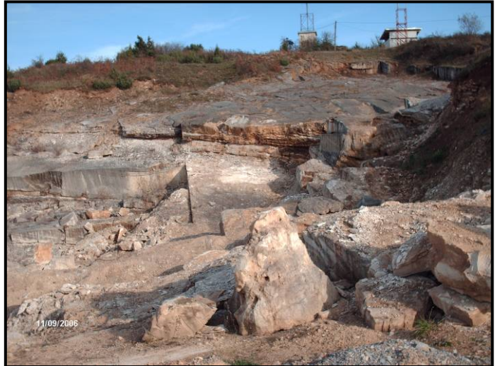
Slika 3. Krovinski slojevi na ležištu Bihacita "Maskara"

Izvedena istraživanja potvrđuju postojanje dva tipa krečnjaka: jedan čvrst, kompaktan i slabo šupljikav, a drugi porozan i manje kompaktan. Pružanje slojeva krečnjaka je SI - JZ sa padom prema SZ pod uglom 15 – 20, maksimalno do 25°.