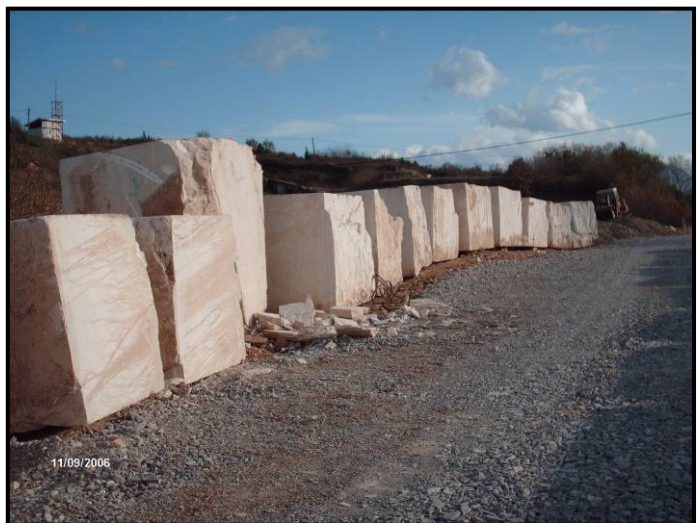
Slika 5. Izrezani blokovi Bihacita spremni za transport

Bihacit je kalcijum karbonatna stijena izgrađena od mikrokristalastog kalcita (karbonatnog mulja), koja je fino dispergovana laporovito - glinovitom materijom. Nešto krupnija klastična zrna kalcita su veoma rijetka. Stijena obiluje organskim ostacima koji su u njenim pojedinim dijelovima primjetno zastupljeni u formi tamnih prevlaka nepravilnog oblika. Od ostalih minerala primjetna su sitna zrna kvarca, minerala gline, i limonitizirani oksidi željeza.